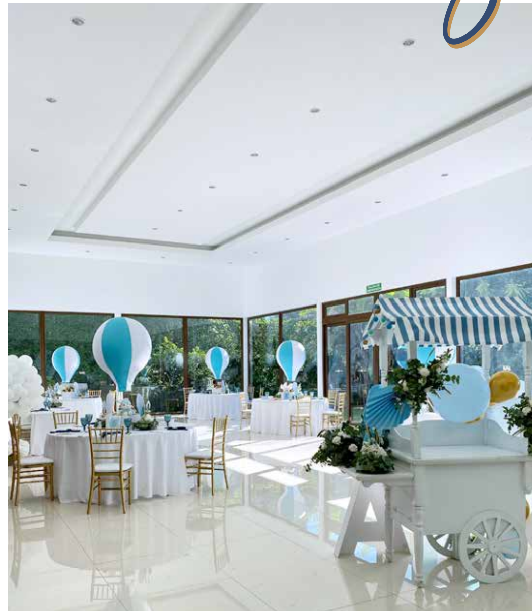
BABY SHOWER - DESPEDIDA DE SOLTERA - TÉ DE COCINA